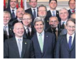
UTANRÍKISRÁÐHERRAR Össur og Kerry ræddu saman í fyrirkvöld.

Þá hvatti hann aðra fundargesti til að stýja stjórnarandstöðuna í Sýrlandi í því að búa til nothæft stjórnkerfi.