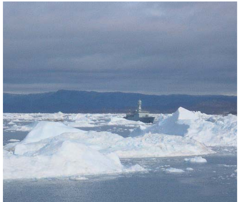
I HAFIS Hér má sjá glitta í varðskip Landhelgisgæslunnar í hafis undan landinu. Samkvæmt nýrri kenningu hefur ísbréðan á norðurskautinu áhrif á sveiflur í veðurfarum sem vara áratugum saman.